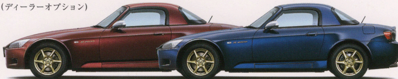
ダークカーディナルレッド・パール