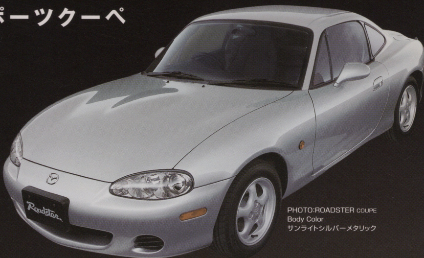
PHOTO:ROADSTER COUPE Body Color サンライトシルバーメタリック