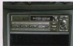
AM/FM電子同調ラジオ&フルジョックカセット