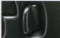
センタードアロック