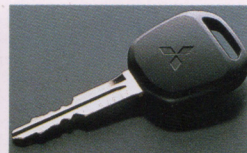
キーレスエントリーシステム (電波式・マスターキー一体化)

SRSエアバッグシステム [SRS=Supplemental Restraint System] シートベルトを補助する乗員保護装置 SRSエアバッグシステムは、横方向や後方向からの衝撃には作動しません。前方向からの衝撃を感知したときのみ作動します。SRSエアバッグシステムは、あくまでもシートベルトを着用することを前提として開発されたシステムですので、必ずシートベルトをご着用ください。なお、チャイルドシートを助手席に後ろ向きで装備しないことなど、ご注意ください。必ず取扱説明書をご覧ください。