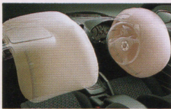
SRSエアバッグシステム (GPバージョンRエアロシリーズの助手席はメーカーオプション)