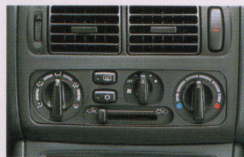
エアコン(マニュアル)