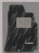
専用フロアカーペット