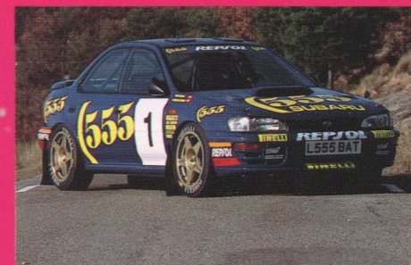
インプレッサWRX '94WRC仕様車