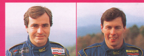
カルロス・サインツ