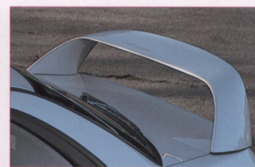
大型リヤスポイラー(ハードトップセダン)