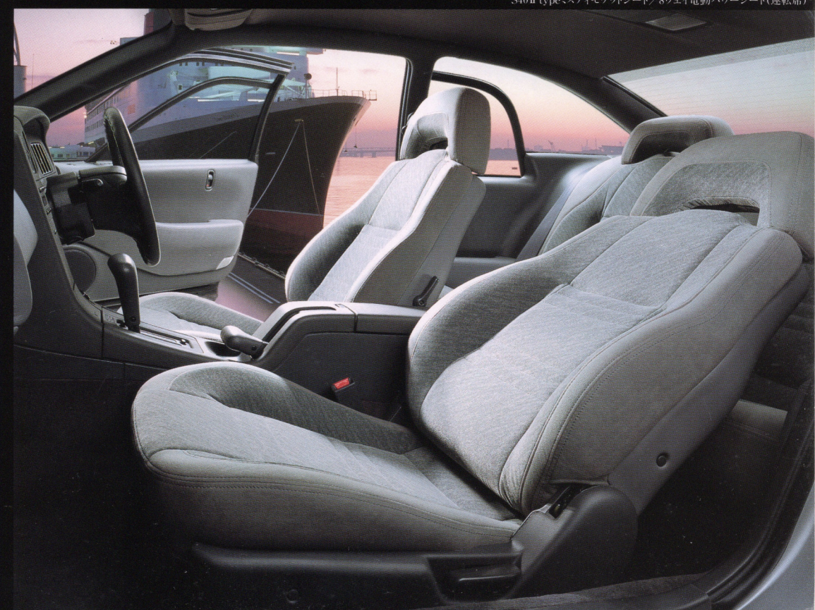
S40 II typeミスティモケットシート/8ウェイ電動パワーシート (運転席)