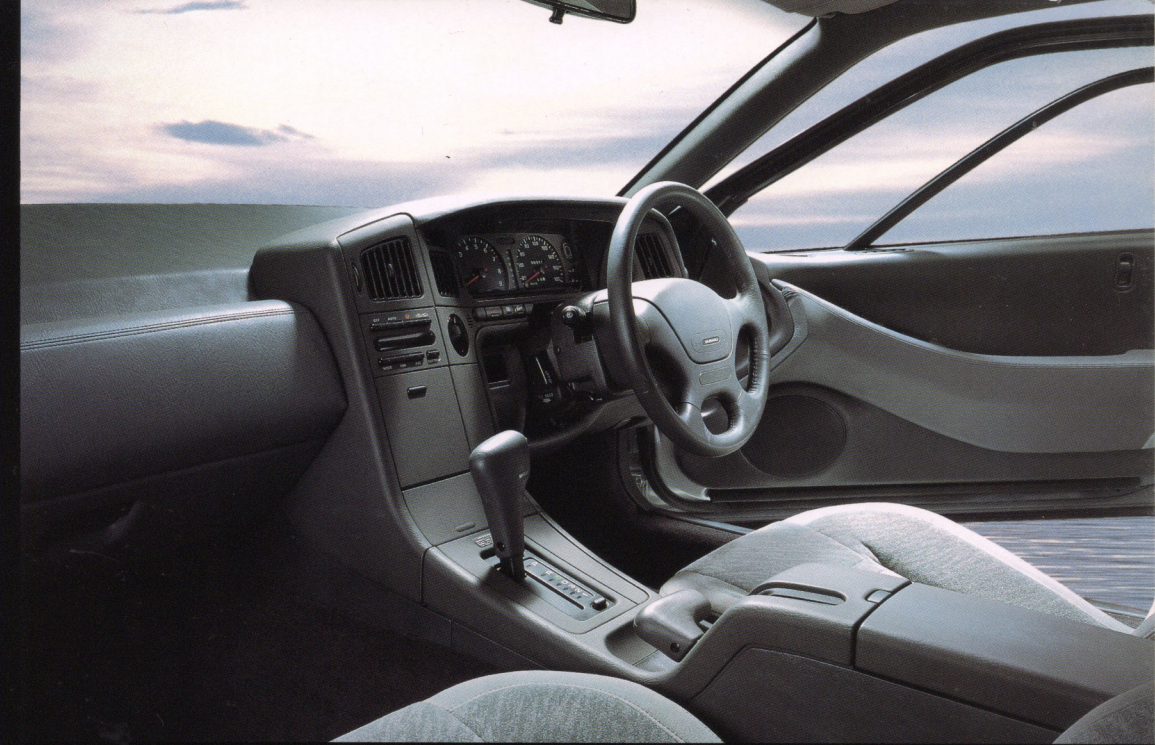
S40 II typeインストルメントパネル/本革巻ステアリングホイール