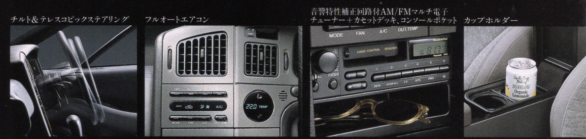
チルト & テレスコピックステアリング フルオートエアコン 音響特性補正回路付AM/FMマルチ電子チューナー+カセットデッキ、コンソールポケット、カップホルダー