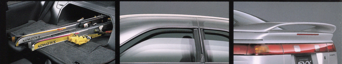
トランクスルー パワーウィンドウ リヤスポイラー<ロータイフ> (ディーラー装着オプション)